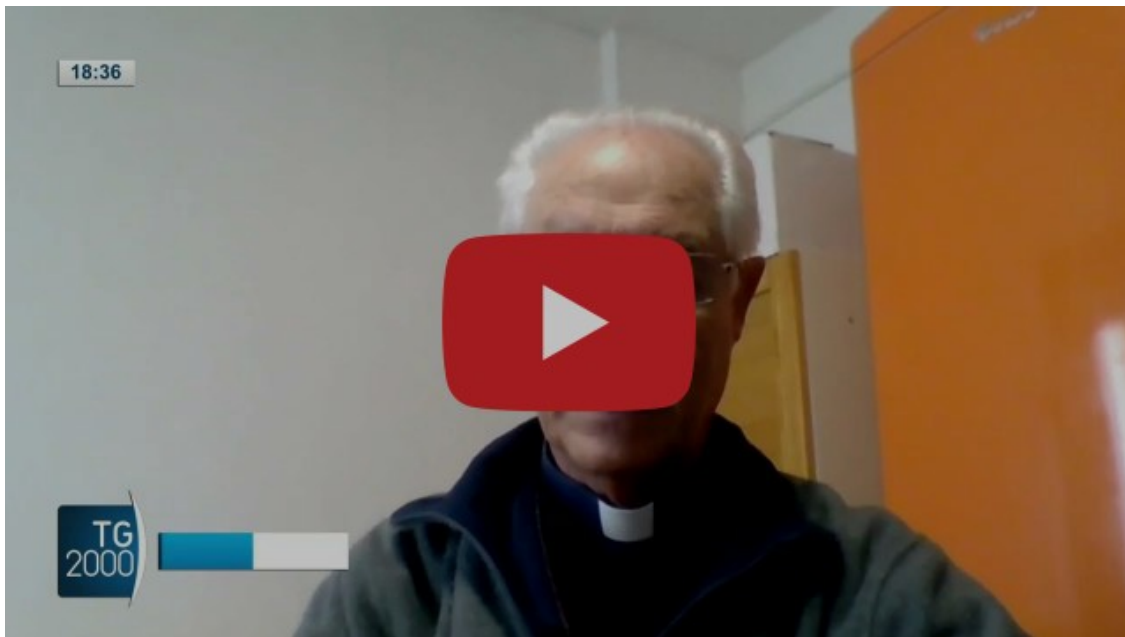
Mgr Paolo Bizzeti : " Une tragédie dans une tragédie ".