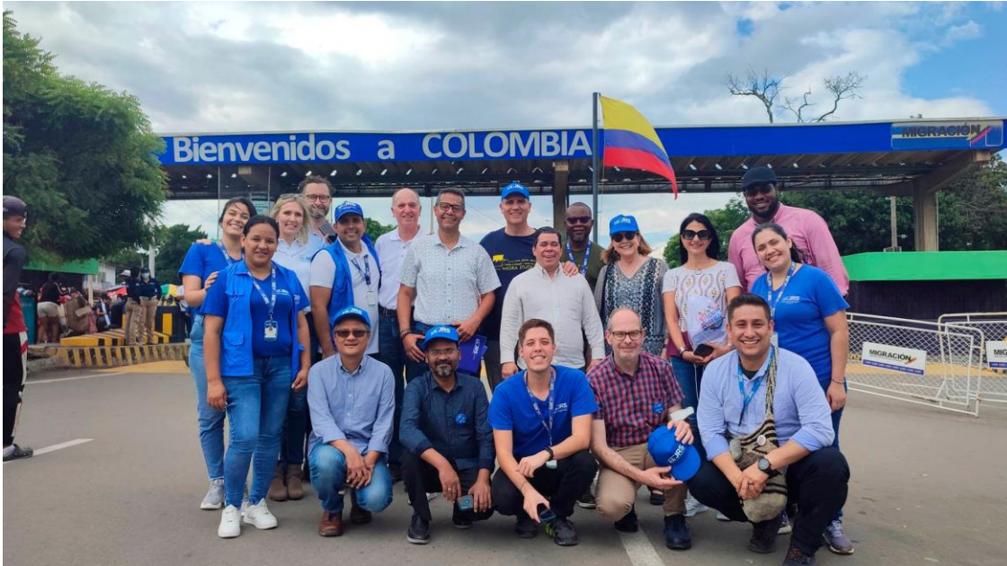
Colombie – Communiqué des directeurs régionaux du JRS En savoir plus..

internationale de Fe y Alegría présentera la "Collection de documents sur les itinéraires des migrants indigènes" En savoir plus..