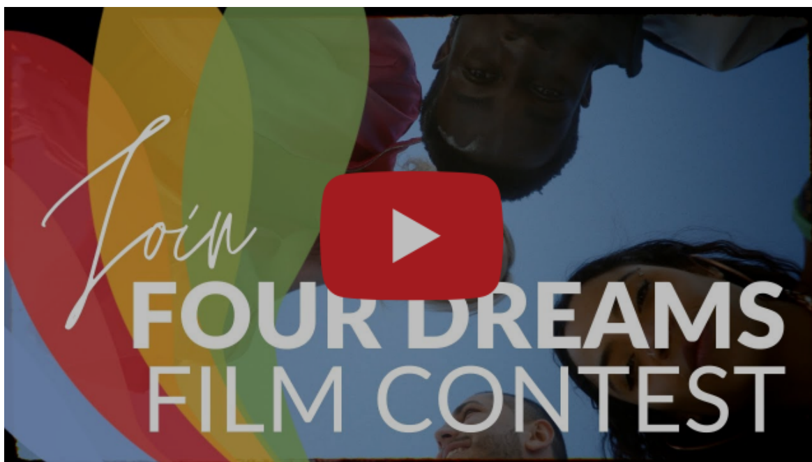
Los Cuatro sueños Concurso de Cine Jesuita